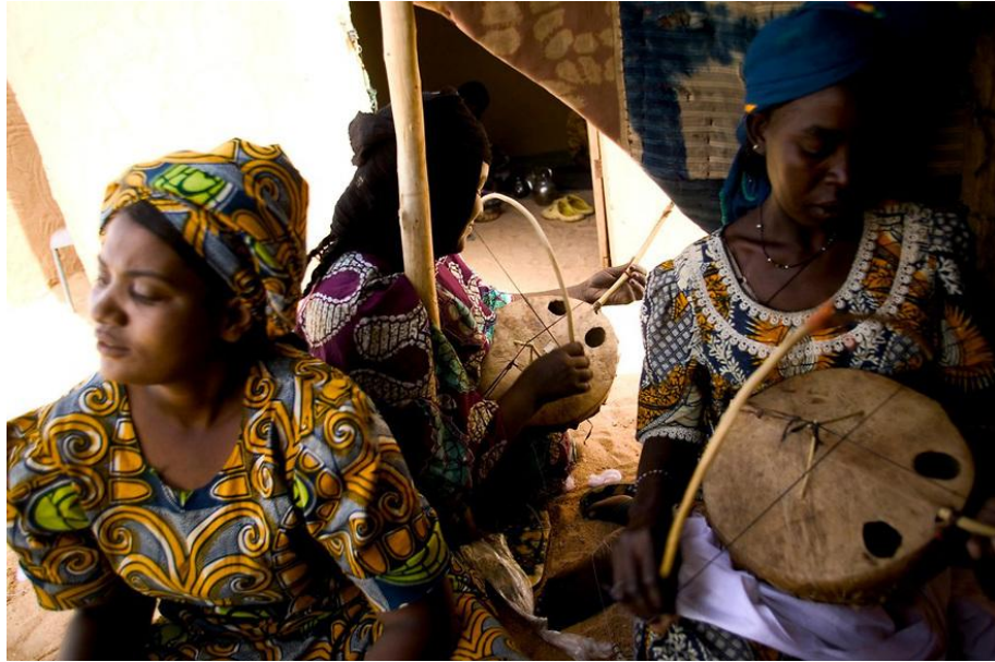
VI. kép: Három tuareg nő imzadon játszik

Az öltözködés tekintetében fontos kiemelnünk arra, hogy a tuaregek legkedveltebb színe a kék, ezért úgy is nevezik őket, hogy a „kék lovagok”. (Freitag 2008: 10) Ruháikat és hajukat indigóval festik kékre, ami az esztétikus hatás mellett a rovarokat is távol tartja. Míg a muzulmánoknál a nők takarják el az arcukat, itt éppen fordítva van, a férfiak tesznek kendőt az arcuk elé. A kendő hasznossági szerepet tölt be: megvédi az orrot és a száját a homoktól.