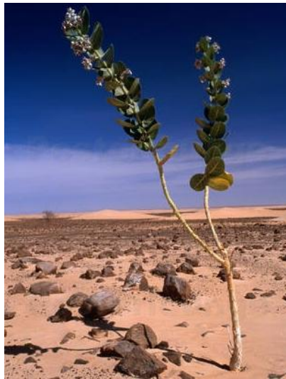
III. kép: Kutyatej – a Szahara „túlélője”

bizonyos időszakokra jellemző, hanem megfigyelhető az az általános tendencia is, hogy az eső mennyisége esztendőről esztendőre csökken. Nigerben például az elmúlt 50 év alatt 40 százalékkal visszaesett a csapadék mennyisége. A száraz periódusok mindig komoly következményekkel járnak: tönkremegy a termés, elpusztulnak az állatok, nincstelenné válnak és éheznek az emberek. Paradox módon többször előfordult már, hogy a hosszú szárazságot követő első esőzés áradást idézett elő, ami halálos áldozatokat is követelt. A globális felmelegedés azonban nemcsak az időjárást határozza meg, hanem az állat-és növényvilág változásait is befolyásolja. Az egykor akáccal teli völgyekben ma már csak a nagyfokú alkalmazkodóképességéről ismert kutyatejet lehet látni. A vidék, amelyről 150 évvel ezelőtt Heinrich Barth még azt írta, hogy „nagyon gazdag a növényzete”, mára sokat veszített diverzitásából. (Friedl 2008:19–20)