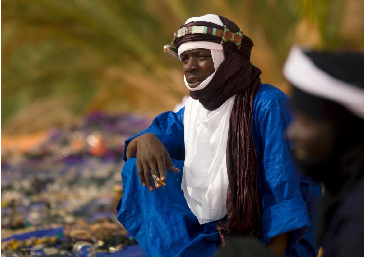
VII. kép: Líbiai tuareg cigarettával a kezében