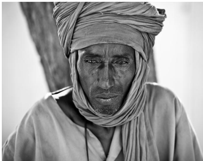
II. kép: Egy Nigerben élő tuareg

Bár a tipizálás könnyen félrevezető lehet, mégis érdekes adalék, hogy egyes kutatók hogyan jellemzik a tuareg fenotípushoz tartozó embereket: “Ők a legmagasabb emberek az egész Szaharában, sőt, világviszonylatban is a legmagasabbak közé tartoznak. (...) Általában vékony, de erős a testfelépítésük, keskeny vállakkal és csípővel, kicsi és inkább lapos mellkassal, vékony végtagokkal, hosszú, karcsú kezekkel és lábakkal rendelkeznek. (...) A bőrük – ha nem süti a nap – fehér, de szokványosan mindig mélytónusú. Az arcuk többé-kevésbé háromszögalakú, fent széles, lent valamivel keskenyebb. Az orruk vékony, egyenes és mérsékelten domború. A hajuk majdnem mindig sötét, a világos szem pedig nagyon ritka, de azért alkalmanként előfordul. Nem ismeretlenek a vöröshajú, kékszemű, szeplős egyének sem. Ez a leírás azokra a tuaregekre vonatkozik, akik nem keveredtek más népcsoportokkal.” (Briggs 1960:125–126)