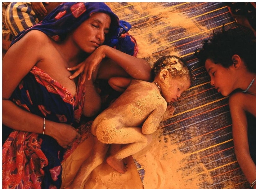
V. kép: Tuareg anya és gyermekei

úgy működik, hogy a nő gondját viseli a háztartásnak, neveli és oktatja a gyerekeket, a férfi pedig dolgozik és keresetéből eltartja családját. (Friedl 2008: 144–151)