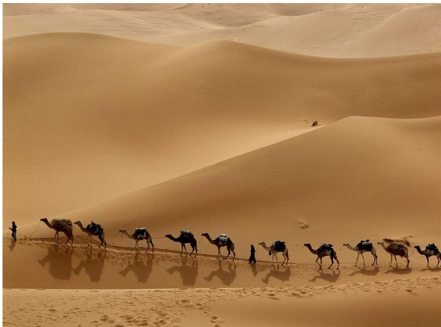
IV. kép: Líbiai tevekaraván

Az elmúlt néhány évtizedben számos új munkaforma alakult ki a tuaregek körében, amelyek többségét az előző fejezetben már ismertettem. Sokan a turisztikai szektorban helyezkedtek el, mások kertépítőként, kézművesként dolgoznak. Egyre inkább visszaszorulóban van a karavánkereskedelem. A legelterjedtebbek a só karavánok, de találni teát, cukrot és ruhákat szállító karavánokat is. Azért van ezekből egyre kevesebb, mert a több száz kilométer hosszú, hetekig tartó karavánút a napjainkban tapasztalható klímaváltozás miatt egyre inkább a szárazság beköszöntésével fenyeget. Ha pedig a tevék nem jutnak az út során elegendő tápanyaghoz, és emiatt meghiúsul a karavánkereskedelem, az nagyon jelentős károkat okoz. Az ilyesféle kockázatvállalás helyett sokan döntenek inkább a modern foglalkozások mellett, amelyek – bár kisebb jövedelemmel járnak – kevesebb rizikót rejtjenek magukban.